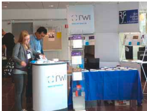
Heja Sverige: Bei der Jahrestagung der European Economic Association (EEA) in Göteborg präsentierte das RWI seine Forschungsergebnisse einem internationalen Publikum.

Informationen: sabine.weiler@rwi-essen.de