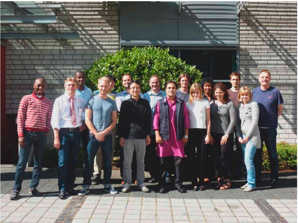
Sommer in Duisburg: Die Teilnehmer der 9. Ruhr Graduate Summer School.

Die Graduate Summer School ist Bestandteil der Ruhr Graduate School in Economics (RGS). Dieses Promotionsprogramm der Volkswirtschaftslehre wird von den Universitäten Bochum, Dortmund und Duisburg-Essen sowie dem Rheinisch-Westfälischen Institut für Wirtschaftsforschung (RWI) gemeinsam getragen.