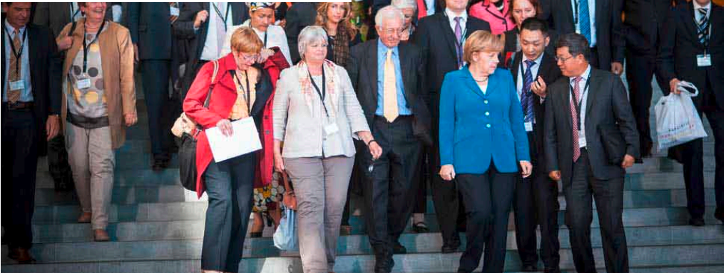
Folgten der Einladung der Kanzlerin und kamen nach Berlin: Internationale Experten aus Politik, Wirtschaft und Wissenschaft.