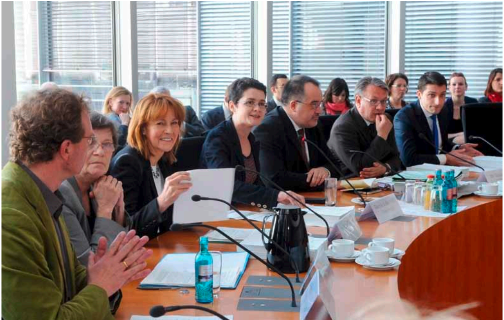
Bei der Arbeit: Die Enquete-Kommission „Wachstum, Wohlstand, Lebensqualität“.

objektive Aussage treffen: Da er sich aus verschiedenen quantifizierten Indikatoren zusammensetzt, entscheidet die Gewichtung dieser einzelnen Faktoren über seine Höhe. Die Alternative ist, den ganzheitlichen Wohlfahrtsindikator als ein Bündel verschiedener Einzelindikatoren darzustellen, das stärker der Komplexität des Wohlstandsbegriffes Rechnung trägt. Ein zu komplexes Indikatorenbündel wird allerdings schnell unübersichtlich und eignet sich daher wiederum nicht für die gesellschaftliche und politische Debatte. Die Aufgabe bestand daher darin, ein hinreichend differenziertes und möglichst einfach zu vermittelndes Indikatorensystem zu entwerfen.